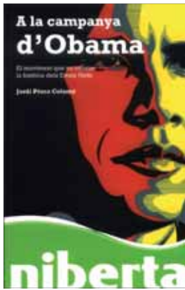
A la campanya d'Obama. El moviment que va canviar la història dels Estats Units Jordi Pérez Colomé Editorial UOC