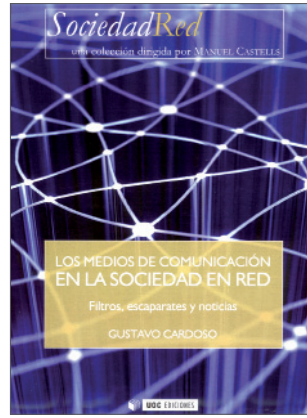
Los medios de comunicación en la sociedad en red. Filtros, escaparates y noticias Gustavo Cardoso Editorial UOC

L'obra recull les ponències presentades a la jornada que va organitzar l'abril de 2008 l'Agència Catalana de Protecció de Dades i els Estudis de Dret i Ciència Política de la UOC sobre el reglament de desplegament de la Llei Orgànica de protecció de dades de caràcter personal (LOPD). Destacats experts en la matèria, tant de l'APDCAT com del món acadèmic i professional, analitzen aspectes com els drets i consentiment de l'interessat, el paper de les administracions públiques davant del nou reglament, les mesures de seguretat o els fitxers de solvència patrimonial i crèdit. ■