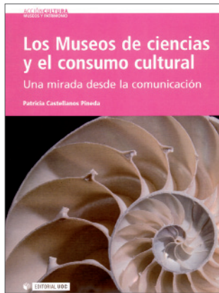
Los Museos de ciencias y el consumo cultural. Una mirada desde la comunicación Patricia Castellanos Pineda Editorial UOC

La museología científica s'ha consolidat gràcies a l'aparició dels centres de ciència, que han revolucionat la relació amb el públic. El nucli principal del llibre, el constitueix la tesi doctoral de l'autora i el camí teórico-pràctic que va iniciar fa més d'una dècada a través del món dels museus de ciència i el consum cultural. El llibre vol contribuir als estudis sobre patrimoni científic, un univers immens que requereix inversió, polítiques clares i el suport acadèmic de les universitats, tradicionalment vinculades al món dels museus etnològics i d'art. ■